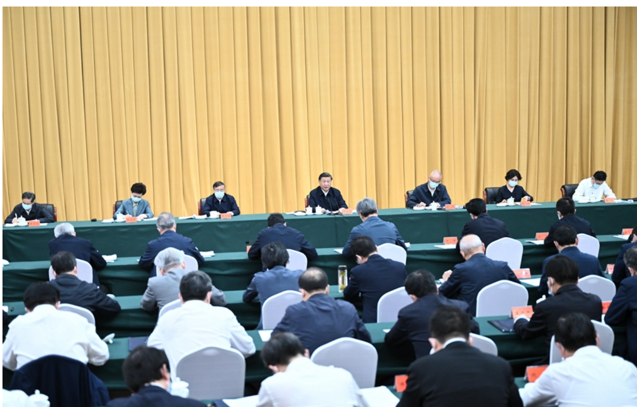
6月2日，中共中央总书记、国家主席、中央军委主席习近平在北京出席文化遗产发展座谈会并发表重要讲话。

2日下午，习近平乘车来到中国历史研究院。中国历史研究院的主要职责是统筹指导全国历史研究工作，整合资源和力量制定新时代中国历史研究规划，组织实施国家史学重大学术项目。习近平走进院内的中国考古博物馆，先后参观文明起源和宅兹中国专题展，了解新石器时代和夏商周时期重大考古发现，并不时询问相关研究工作进展。随后，习近平察看了中国历史研究院部分馆藏珍贵古籍和文献档案，并在中国历史研究院科研工作成果展前听取了有关情况汇报。习近平强调，认识中华文明的悠久历史、感知中华文化的博大精深，离不开考古学。要实施好“中华文明起源与早期发展综合研究”、“考古中国”等重大项目，做好中华文明起源的研究和阐释。中国历史研究院成立4年多来，组织开展一系列国家级重大科研项目和学术工程，取得了一批高质量成果，值得肯定。希望你们继承优良传统，团结凝聚全国广大历史研究工作者，不断提高研究水平，为中国式现代化建设贡献更多中国史学的智慧和力量。