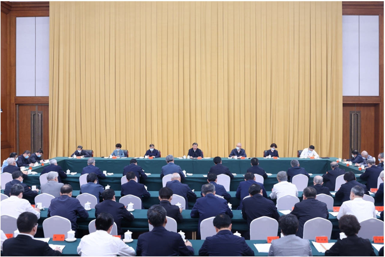
6月2日，中共中央总书记、国家主席、中央军委主席习近平在北京出席文化遗产发展座谈会并发表重要讲话。

习近平指出，中华优秀传统文化有很多重要元素，共同塑造出中华文明的突出特性。中华文明具有突出的连续性，从根本上决定了中华民族必然走自己的路。如果不从源远流长的历史连续性来认识中国，就不可能理解古代中国，也不可能理解现代中国，更不可能理解未来中国。中华文明具有突出的创新性，从根本上决定了中华民族守正不守旧、尊古不复古的进取精神，决定了中华民族不惧新挑战、勇于接受新事物的无畏品格。中华文明具有突出的统一性，从根本上决定了中华民族各民族文化融为一体、即使遭遇重大挫折也牢固凝聚，决定了国土不可分、国家不可乱、民族不可散、文明不可断的共同信念，决定了国家统一永远是中国核心利益的核心，决定了一个坚强统一的国家是各族人民的命运所系。中华文明具有突出的包容性，从根本上决定了中华民族交往交流交融的历史取向，决定了中国各宗教信仰多元并存的和谐格局，决定了中华文化对世界文明兼收并蓄的开放胸怀。中华文明具有突出的和平性，从根本上决定了中国始终是世界和平的建设者、全球发展的贡献者、国际秩序的维护者，决定了中国不断追求文明交流互鉴而不搞文化霸权，决定了中国不会把自己的价值观念与政治体制强加于人，决定了中国坚持合作、不搞对抗，决不搞“党同伐异”的小圈子。