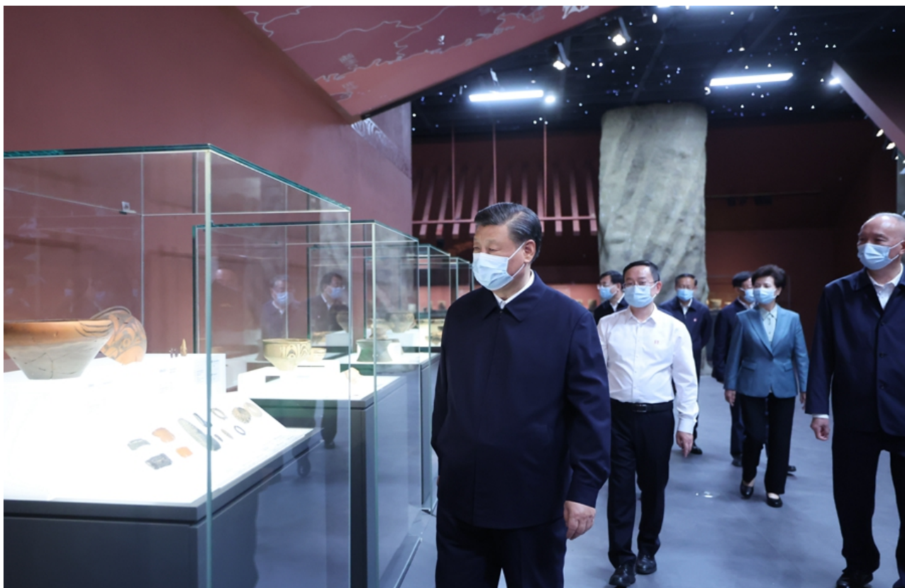
6月2日，中共中央总书记、国家主席、中央军委主席习近平在北京出席文化遗产发展座谈会并发表重要讲话。这是座谈会前，习近平2日下午在中国历史研究院考察。