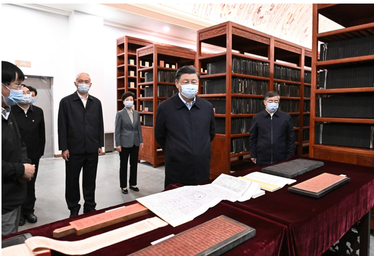
6月2日，中共中央总书记、国家主席、中央军委主席习近平在北京出席文化传承发展座谈会并发表重要讲话。这是座谈会前，习近平1日下午在中国国家版本馆考察时，在兰台洞库了解馆藏精品版本保存情况。