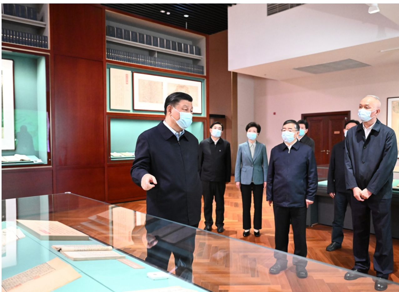
6月2日，中共中央总书记、国家主席、中央军委主席习近平在北京出席文化遗产发展座谈会并发表重要讲话。这是座谈会前，习近平1日下午在中国国家版本馆考察。