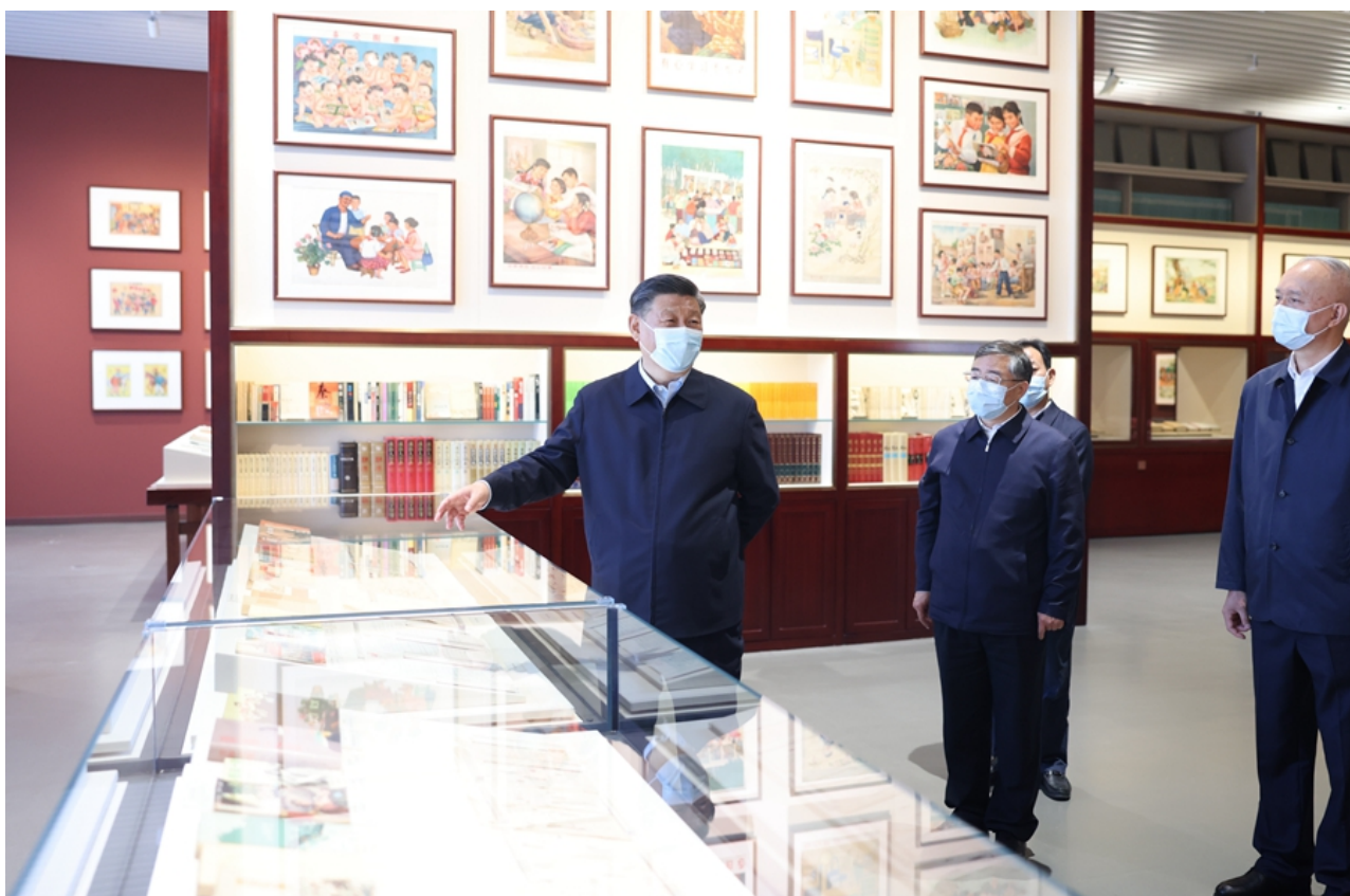
6月2日，中共中央总书记、国家主席、中央军委主席习近平在北京出席文化传承发展座谈会并发表重要讲话。这是座谈会前，习近平1日下午在中国国家版本馆考察。