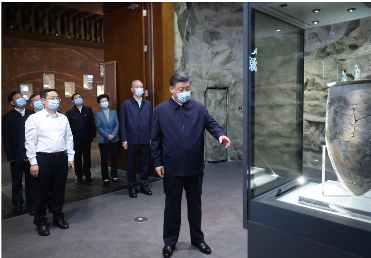
6月2日，中共中央总书记、国家主席、中央军委主席习近平在北京出席文化遗产发展座谈会并发表重要讲话。这是座谈会前，习近平2日下午在中国历史研究院考察。