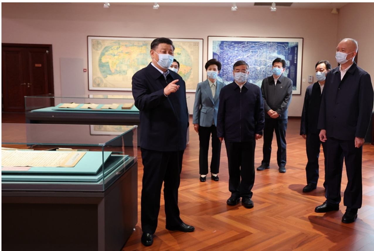
6月2日，中共中央总书记、国家主席、中央军委主席习近平在北京出席文化遗产发展座谈会并发表重要讲话。这是座谈会前，习近平1日下午在中国国家版本馆考察。